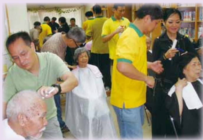
• 義工隊的第一次義剪服務 F.S. volunteer team provides free haircut service