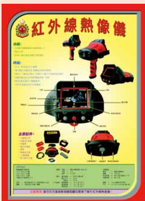
• 消防局張貼消防工具簡介海報 A poster on the introduction of fire services equipment is posted in fire station

由新界總區副總長何乃海領導的「消防局操練檢討小組」，已完成有關的檢討報告。其中建議部門當採用新型號消防車、工具和指引時，一併製作消防車輛 / 工具使用 / 指引簡介的訓練海報，並張貼在局內，方便屬員能隨時重溫有關工具的功能和規格。