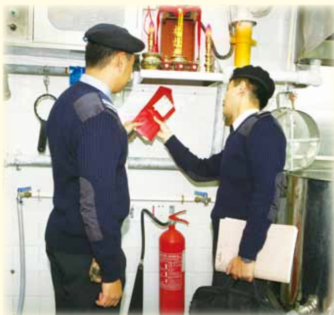
消防人員巡查食肆消防裝置 Fire personnel inspect fire service installations at a food premises

為了進一步改善緊急救護服務，處長表示部門將於今年 8 月推行電腦輔助的服務質素保證系統，透過分析救護員在處理不同病人紀錄的情況，以改善輔助醫療救護服務保證工作的效率及成效。