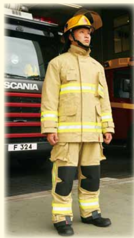
新抗火衣採用 PBI Matrix 物料提供更佳保護 New fire protective suit features PBI Matrix fire resistant material to provide better protection

處長表示為應付社會急速發展的需要，消防人員無論在裝備及技能方面都有所提升，部門今年已開展了連串提升技能的訓練，包括高空、公路、急流及攀山等拯救工作。